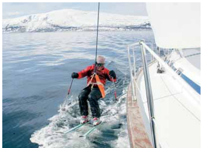
Hvem har sagt at man ikke kan stå på vannski med en Bavaria? Under mottoet «Våga vågra vuxenlivet» prøver manskapet ut nye former for vannrelaterte abligøyer.