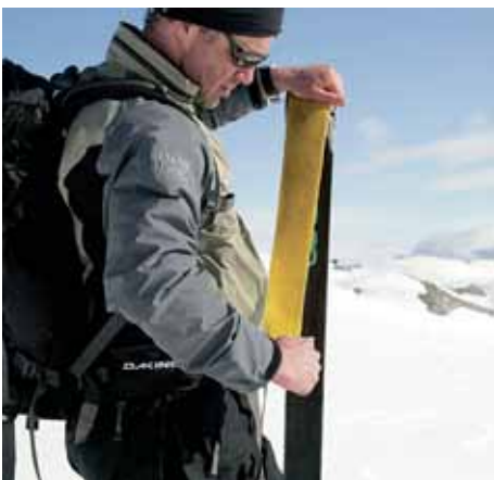
Fjellene i Lyngsalpene er bratte, men skifeller gjør oppstigingene en god del lettere.

for skikjøring. Men, det er til toppen vi skal. Sånn er det bare!