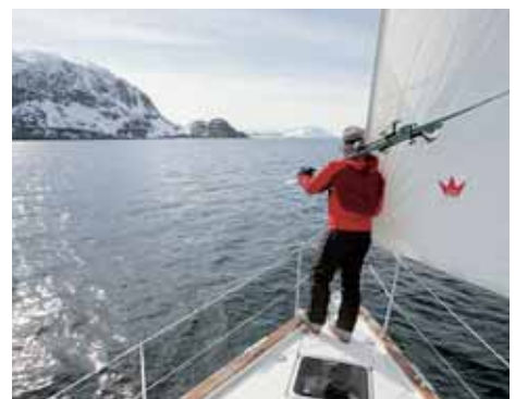
I Lyngen stiger fjellene rett opp fra havet, noe som gjør området perfekt for kombinasjonen skikjøring og seilturer.

På vei hjem till Tromsø gjør vi et forsøk på å blande seiling og skikjøring på et annerledes vis. Under parolen «Våga vågra vuxenlivet»