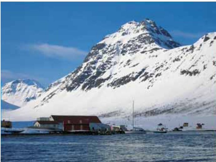
Det lille fiskersamfunnet Akkarvik på Arnøya har ikke mer enn 15 innbyggere.