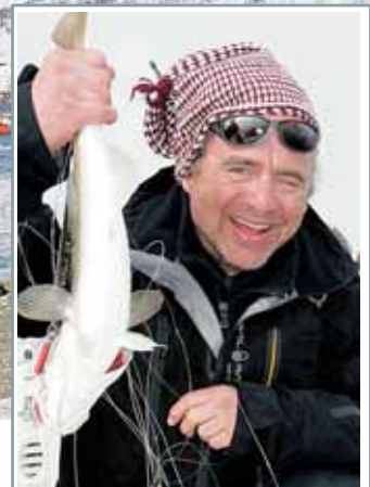
Artikkelforfatteren med fiskelykke.

Kombinasjonen Seiling og skikjøring i charterbåt er forholdsvis nytt. I Troms lokker Lyngsalpene med sine mange topper på rundt 800 – 900 meter over havet. Aller høyest er Jiekevarre på 1 833 moh. Lofoten, Narvik og Hårundfjorden ved Ålesund er andre populære steder for seiling og ski. Ombord i båtene finnes varme dusjer, sengeplasser (som regel køyesenger), skipper, og fjellguide. Bekvemmeligheten varierer ut fra antallet gjester. Fjellguide er obligatorisk for lavinekjørere. Guiden velger fjell ut fra gruppens nivå, ønsker og værforhold. For mer info www.sarahsailing.com ,